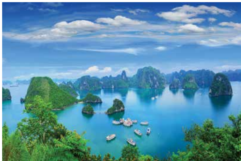
La célèbre baie d'Halong